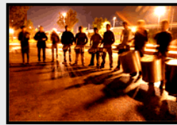
Un ensayo con luz mágica A rehearsal with magical light