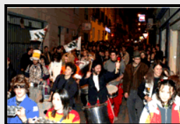
En Chueca, día del Orgullo Gay In Chueca, Gay Pride Parade