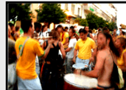
Encuentro Estatal en Córdoba National Samba Meeting in Córdoba