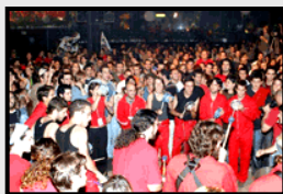
Sala Aqualung con Los Delinquentes Aqualung concert space with Delinquentes